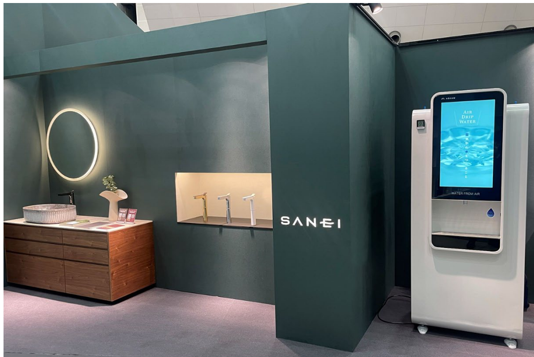
2月に実施した展示会の様子